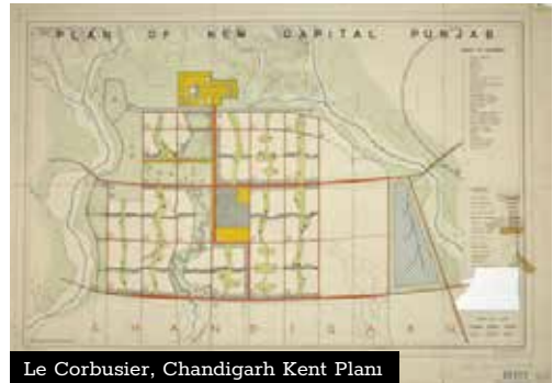
Le Corbusier, Chandigarh Kent Planı