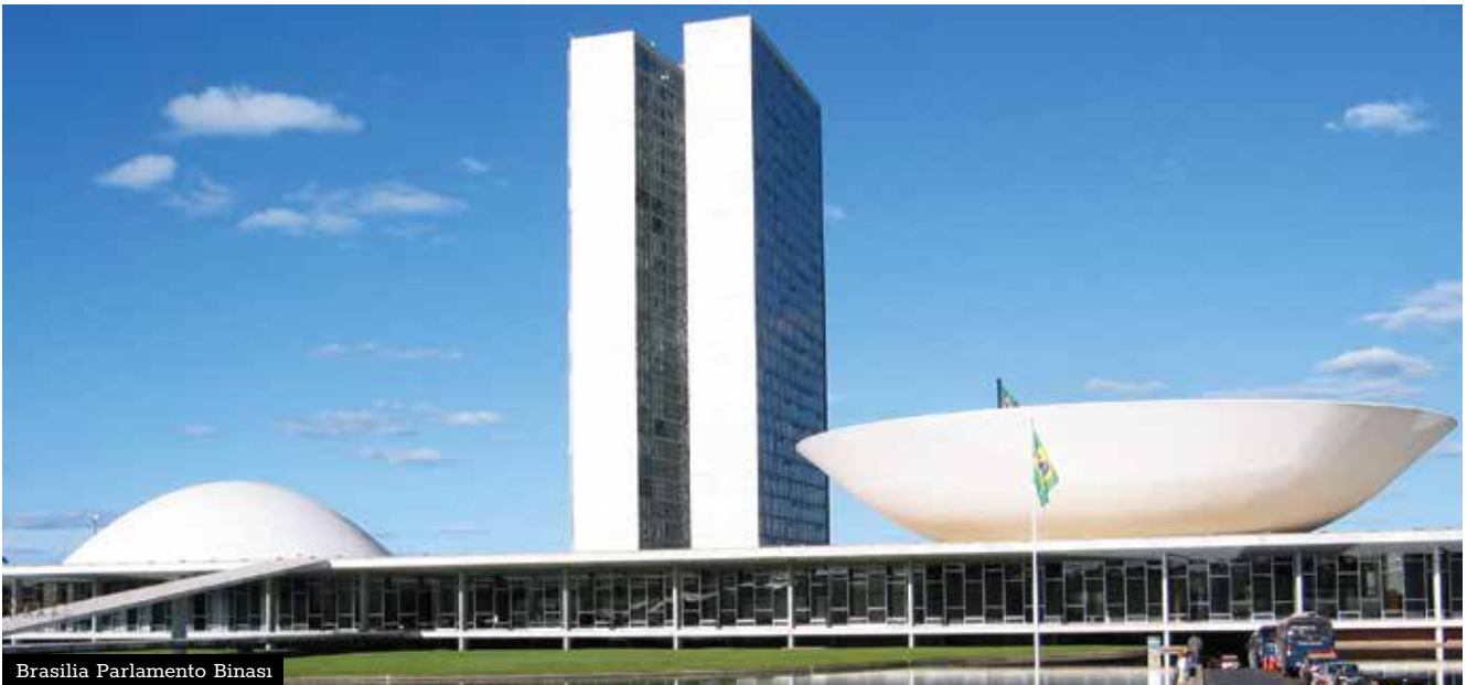
Brasilia Parlamento Binası

Anayasa'da da Brasilia başkent olarak resmîyet kazanmasına rağmen fiziki olarak nihayete erdirilemeyen bir karar olarak askıda kalmıştı. Başkentten taşınması kararı çok daha önce