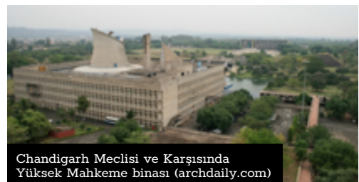
Chandigarh Meclisi ve Karşısında Yüksek Mahkeme binası (archdaily.com)