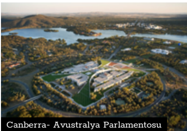
Canberra- Avustralya Parlamentosu